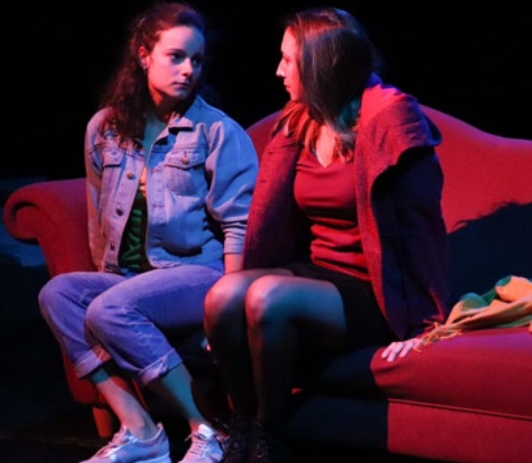
ILLUSTRATION Olivier Duriaux