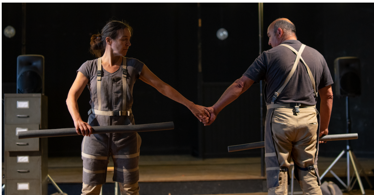
@Elina / répétition théâtre Bel Air-Nantes le 20 mai 2022

Voilà, c'est de ça dont je voulais vous parler. Ça s'appelle la violence.